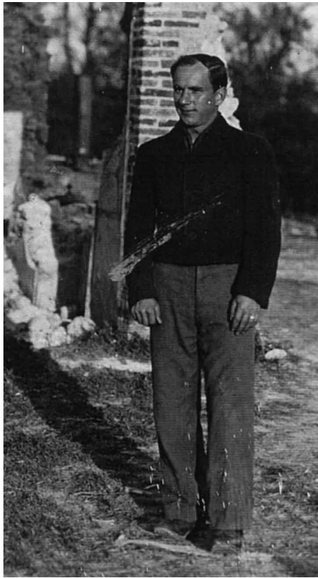
1947: Heinz in Frankreich als Kriegsgefangener