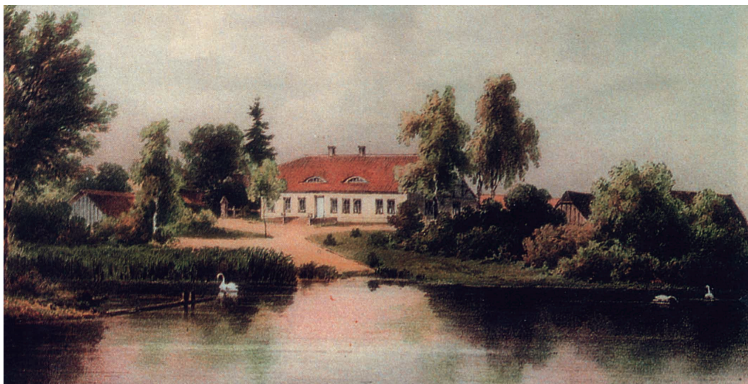
Das Herrenhaus von Kerschitten um 1860; nach einer Zeichnung von Alexander Ducker