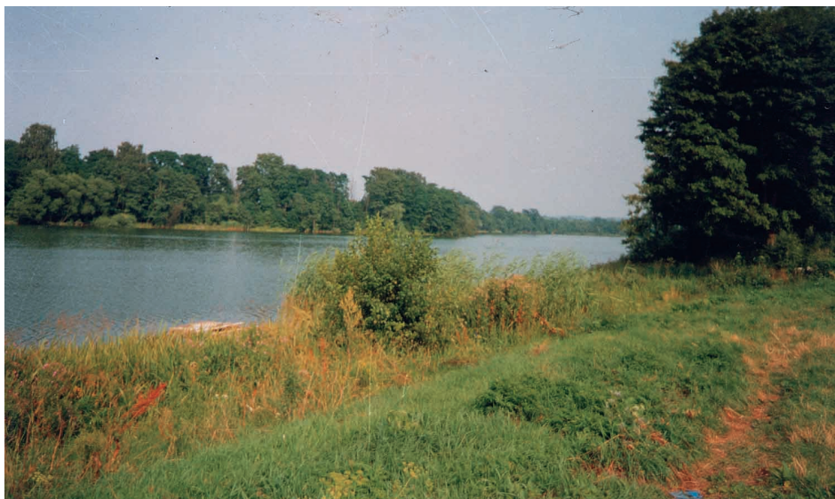
Die auf dem Foto im Vordergrund sichtbare Uferzone, die einst als Pferdeschwemme und im Sommer als Badestrand diente, hat sich, wie so vieles, völlig verändert.