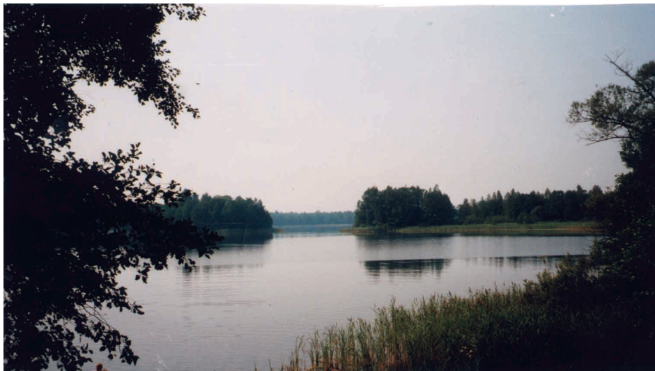
Vom Südost-Ufer Blick auf den Kerschitter See

1785 wird Kerschitten als adliges Vorwerk und Dorf aufgeführt. Die dann 1807 von Freiherr vom Stein in die Wege geleitete Bauernbefreiung hat offensichtlich die Kerschitter Bauern von ihrem Besitz „befreit“. Solches ist im Laufe dieser Aktion, die 1859 ihren Abschluss fand, 10 000en Bauern widerfahren.