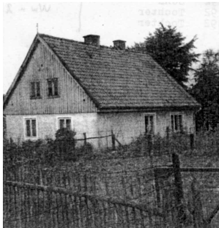
Siedlungshaus in Stein