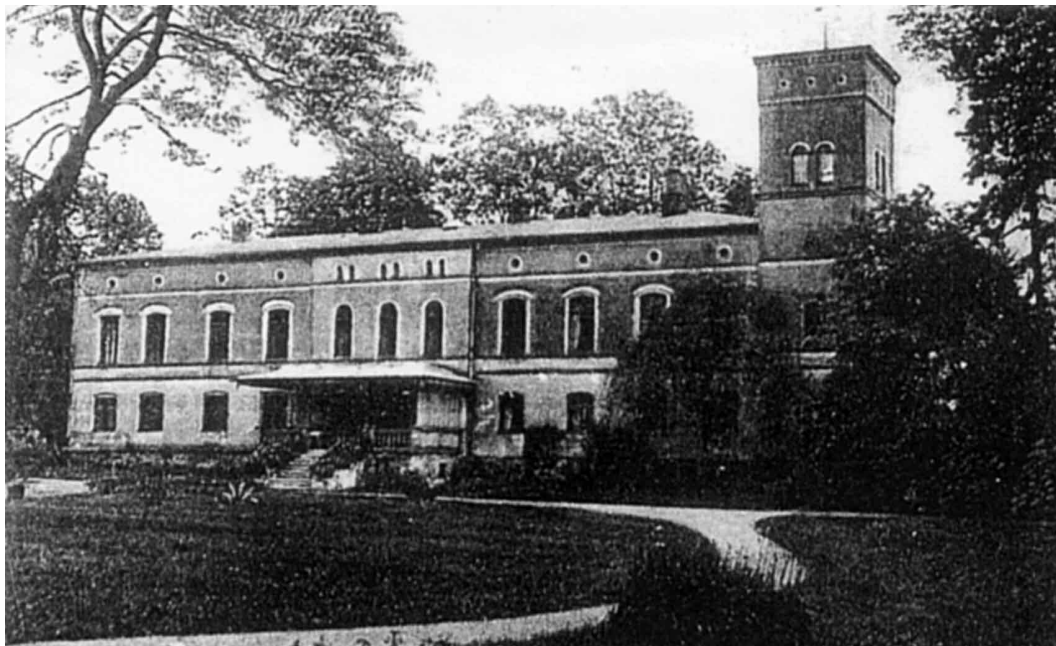
Das Gutshaus in Stein